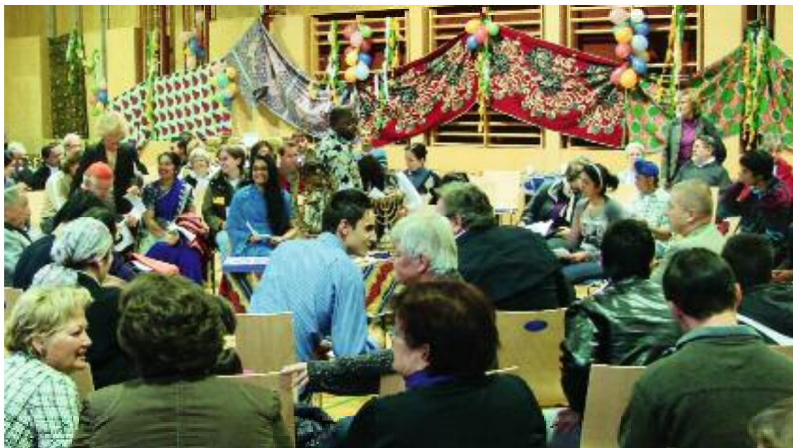
Begegnung und Austausch standen im Mittelpunkt des Bondeko-Eine-Welt-Festes.