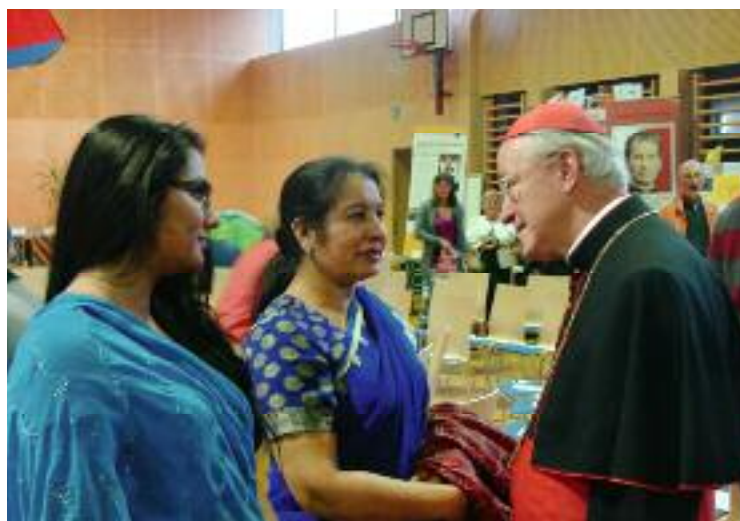
Erzbischof Alois Kothgasser begrüßt Gäste aus Indien.