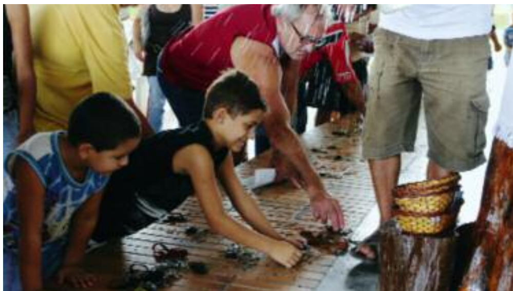
Segnung der Autoschlüssel. Es sieht ein wenig spektakulär aus, doch dahinter steckt die Frömmigkeit vieler Brasilianer, die auf Gottes Hilfe vertrauen.