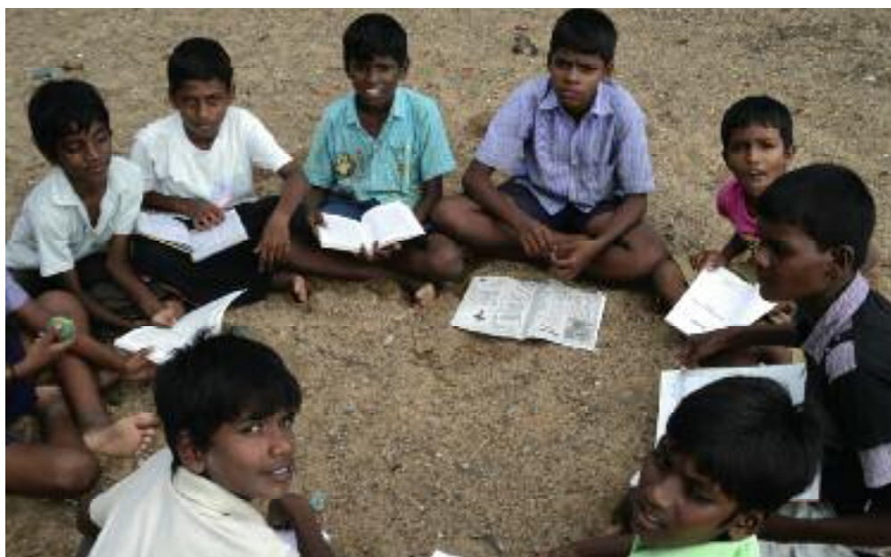
Bildung ist die einzige Möglichkeit, um der Armut zu entkommen. Deshalb bringen viele Eltern große Opfer um ihren Kindern eine gute Ausbildung zu ermöglichen.