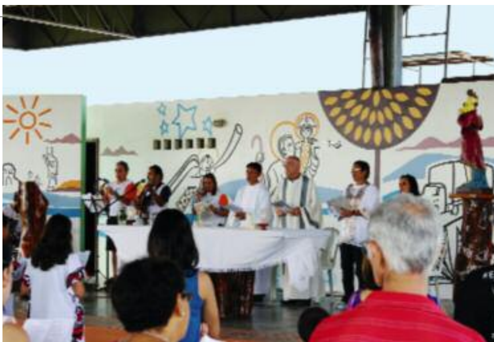
Messfeier in der Christophorus-Kirche. Fernfahrer aus ganz Brasilien kennen und schätzen diesen Treffpunkt. Die Kirche ist auch der Ort, wo sie den Rosenkranz beten, ihre Anliegen in ein bereitliegendes Buch einschreiben, zu einem Seelsorgsgespräch kommen oder ihre Kinder taufen lassen.

Schon aus diesem Grund war und ist die Christophorus-Autobahnkirche in Fortaleza mittlerweile in ganz Brasilien bekannt. Die Fern-