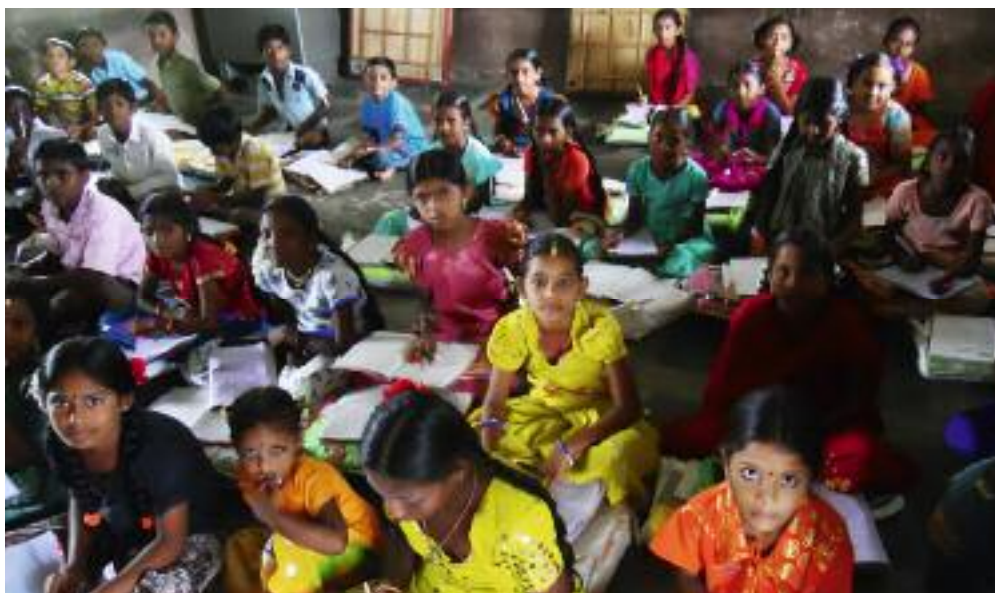
Indien verzeichnet den höchsten absoluten Bevölkerungszuwachs aller Länder der Erde. Nach Schätzungen der Vereinten Nationen wird Indien 2045 China als bevölkerungsreichsten Staat ablösen.

Nach vielen Anfangsschwierigkeiten haben wir nun 28 Priester, zwölf Mitbrüder mit Ewigen Gelübden, 36 mit zeitlichen und acht Novizen. Ich bin der einzige Ausländer