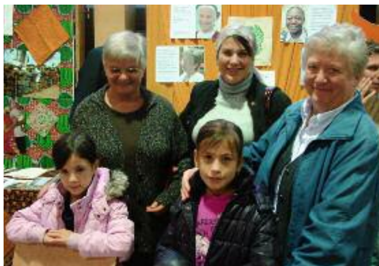
Vor dem Stand der Missionarinnen Christi: Schwestern und Besucher.