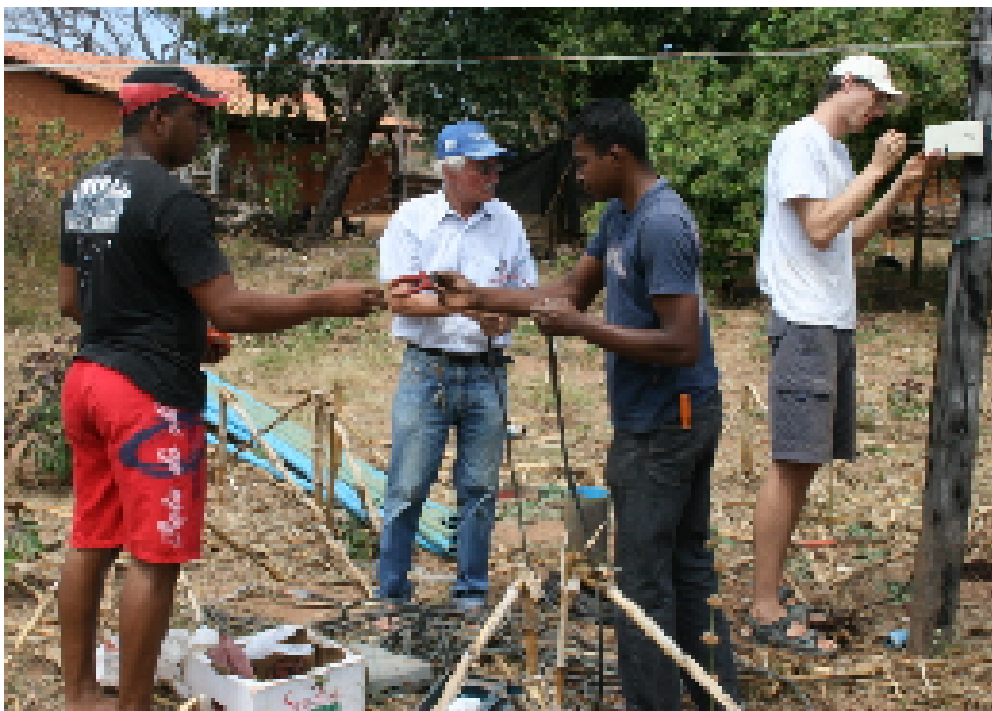
Ein Garten entsteht nicht von selber. Viele Leute helfen mit, damit der Brunnen gegraben wird und die Förderung des Wassers durch Solarenergie funktioniert.